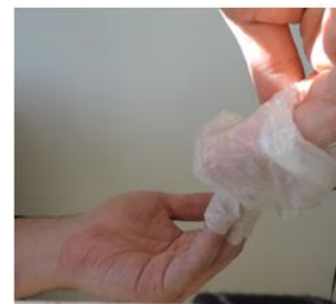
6. Une fois les gants ôtés, les jeter. Se laver les mains.

Les conseils proposés sont établis en l'état actuel des connaissances scientifiques et légales, ils ne soustraient pas l'Autorité Territoriale à l'obligation d'évaluer les risques professionnels et mettre en place des mesures de prévention.