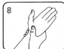
7. Frotter les poignets de chaque main