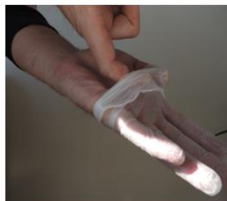
5. Retirer le deuxième gant.