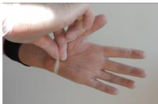
1. Placer le gant au niveau du poignet. Eviter de toucher la peau