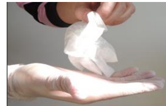
3. Le garder au creux de la main gantée ou le jeter