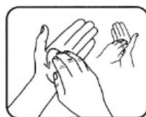
6. Frotter la pulpe des doigts dans la paume de l'autre main