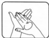
1. Frotter vos mains paumes contre paumes