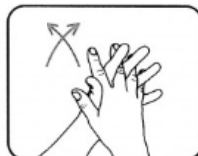
3. Frotter paume contre paume avec les doigts entrelacés