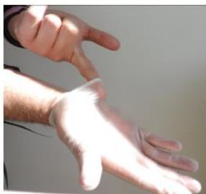
4. Glisser les doigts à l'intérieur du deuxième gant. Eviter de toucher l'extérieur du gant.