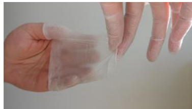
2. Retirer le gant